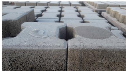
Бетонний елемент оброблений Fasil V