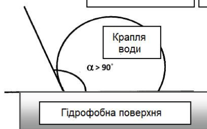
Бетонний елемент не оброблений Fasil V